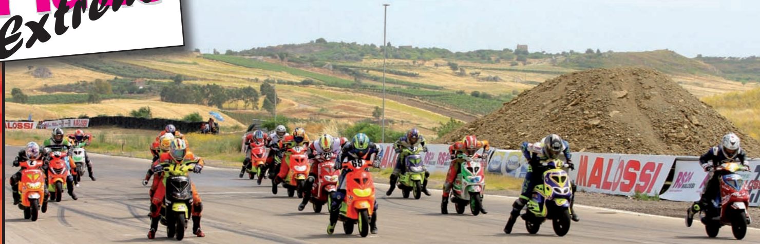
La partenza della ScooterMatic Extreme Sicilia a Racalmuto durante la terza prova